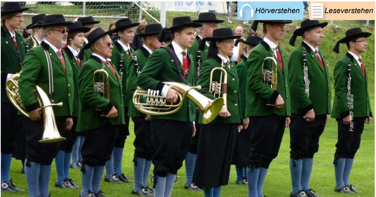
Foto: Wettbewerb „Musik in Bewegung“, www.leonhard-raunzer.blogspot.com

Text: Typisch deutsch - Sind die Deutschen wirklich so pünktlich?